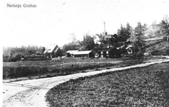
Nartorp, som det såg ut någon gång under den sista perioden av gruvans historia, 1911-1927

Det största malmfältet är Nartorp, som bearbetats nästan oavbrutet från 1817 till 1927. Gruvan upptäcktes 1708. Under åren 1817 - 32 brötos här omkr. 9 000 ton c:a 60 - procentig malm, som fraktades med dragare till Glädjan för utskeppning. År 1873 bildades Nartorps gruvaktiebolag, som efter att hela tiden ha uppehållit gruvdriften 1911 sålde gruvorna till Stora Långviks gruvaktiebolag. Under det gamla bolagets tid skedde brytningen för hand, och malmen transporterades upp i tunnor, men man fick med dessa gammaldags metoder upp