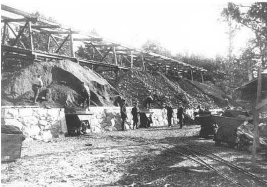
Ändstation för linbanan och omlastning vid kajen, Björnvik.