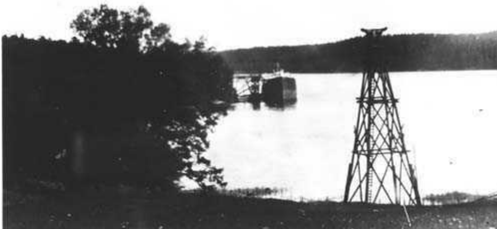
Lastkaj vid Björnvik. Linbanebock 20m hög vid stranden, den högsta av alla.