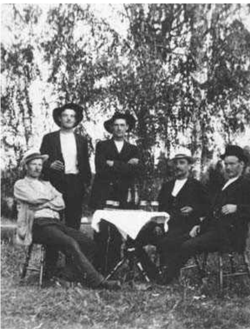
Linbanebyggare vid Evertsberg.

Draglinan var 15-20 millimeter tjock. Last eller bärlinan var 50 mm tjock till Björnvik och 30 mm från Björnvik. Vid Björnvik finns 2 stora lod till bärlinan och ett litet till draglinan.